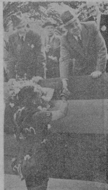
Julián Berrendero es felicitado por el general Moscardó, al lograr uno de sus innumerables triunfos. Julián va clasificado en 4.º lugar de nuestra Vuelta

Recordamos a nuestros lectores, que la entrada de los corredores en Palma, desde Muro, está señalada por la calle del Marqués de la Fuensanta, en las inmediaciones de las Estaciones de los Ferrocarriles.