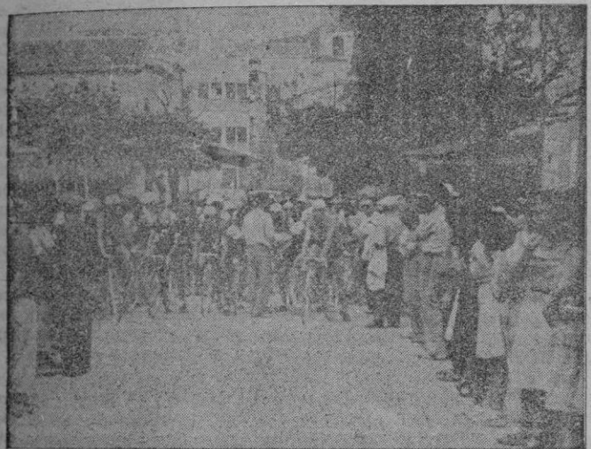
Dispuestos a tomar la salida en Artá