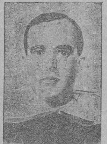
El Padre Manuel Suárez Formán, que ha sido elegido Maestro General de la Orden de Predicadores (Dominicos).