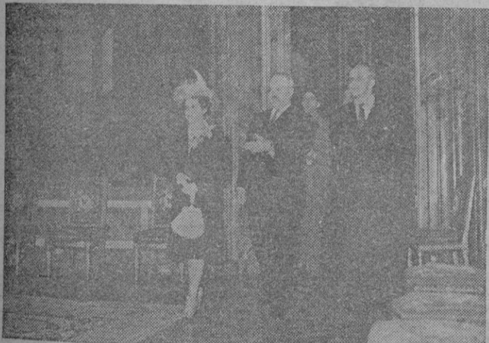
El Ministro de Asuntos Exteriores soviético Molotov muestra al Embajador de la U.R.S.S. en París y a su esposa las riquezas que contienen las Cámaras que pertenecieron a los Reyes de Francia, en la recepción ofrecida a los Delegados de la Conferencia de París por Mr. Bidault.

La recepción en Versalles en honor de los Delegados de la Conferencia de París