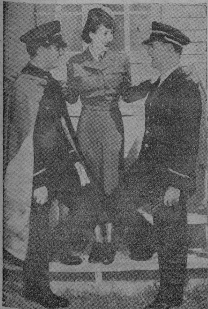
Washington.—De izquierda a derecha: uniforme azul con capa para soldados; uniforme verde para el servicio auxiliar femenino; y uniforme azul para oficiales; nueva vestimenta que ha sido propuesta para las fuerzas armadas de los Estados Unidos.

Los oficiales del ejército rojo son objeto de un trato privilegiado en la Unión Soviética y saben que se les aplicarán las más rigurosas medidas disciplinarias si se descubren sus intentos de desertión. Sin embargo, se afirma que continúan intentándolo.—Efe.