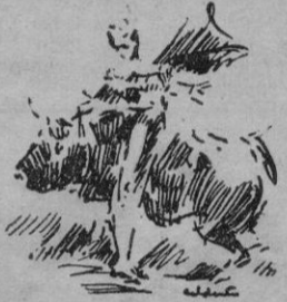
El catalán en una segoviana