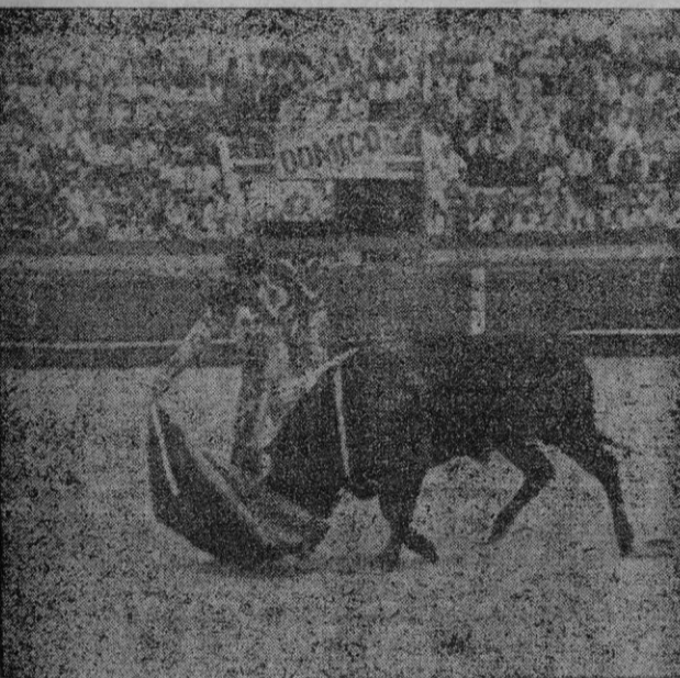
Pericás en un soberbio derechazo