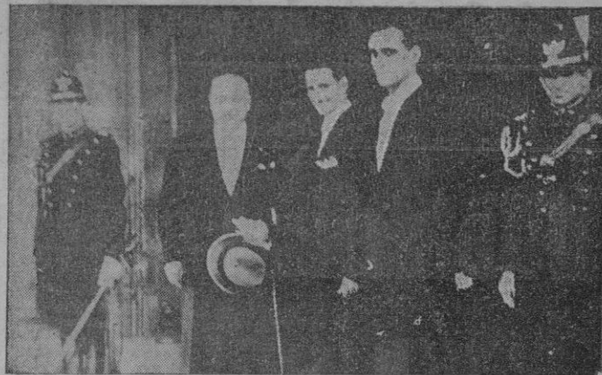
ROMA.—El Embajador de España en Roma, don José Antonio Sangroniz, fotografiado a la salida de Palacio después de haber presentado sus Cartas Credenciales al presidente de la República Italiana, De Nicola.