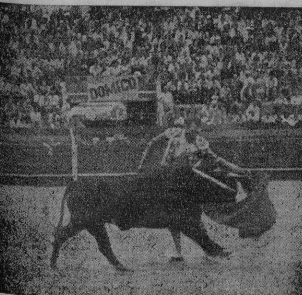
García corre la mano en un natural

lidades de los tres. Son toreros completamente distintos, y cada uno posee disposiciones suficientes para llegar a matadores de trono.