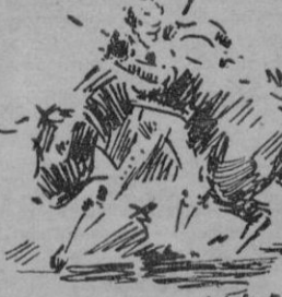
Un molinete del mallorquín.