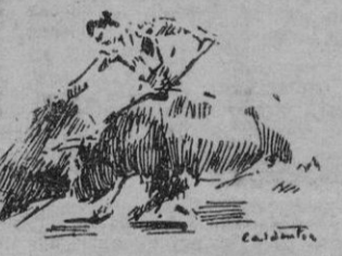
¿Y aquellos naturales con la derecha?