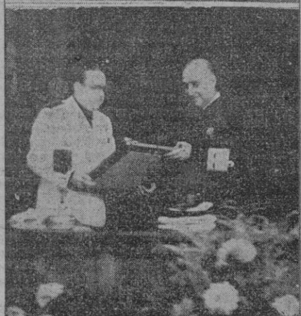
Diferentes aspectos del triunfal viaje del Caudillo por el norte de España; desde el balcón del Ayuntamiento presencia el desfile de la producción industrial montañesa. A su llegada al barrio de pescadores de Maliaño recibe un ramo de flores de una niña que le dió la bienvenida. — En Torrelavega, recibe el título de Alcalde Honorario