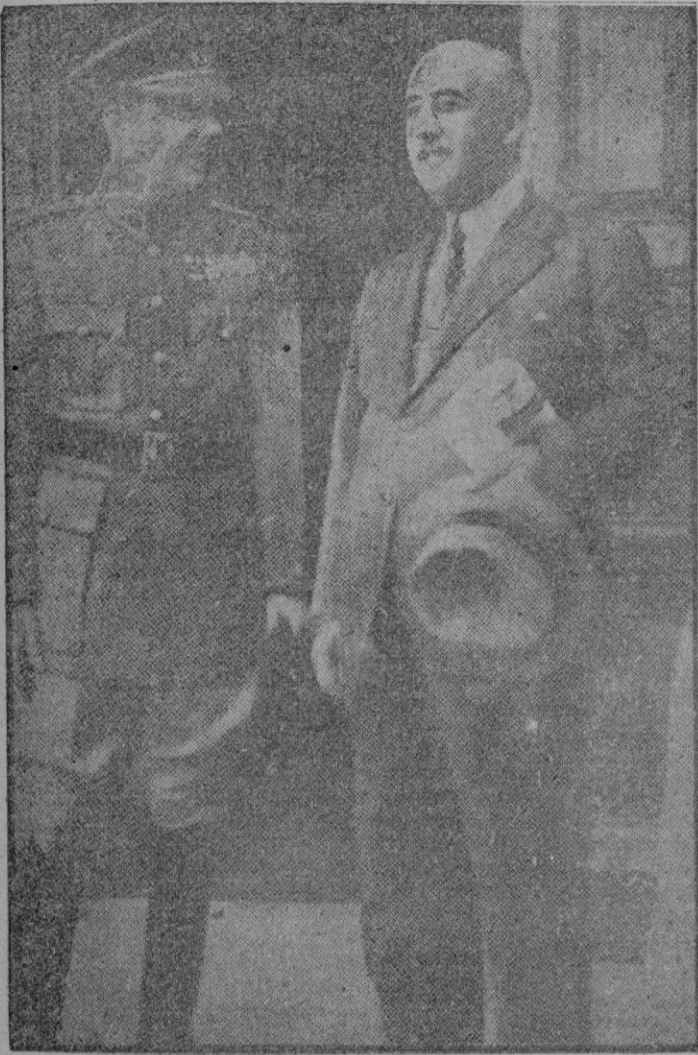
S. E. el jefe del Estado en una instantánea de su visita a la yeguada Militar de Lore Toki