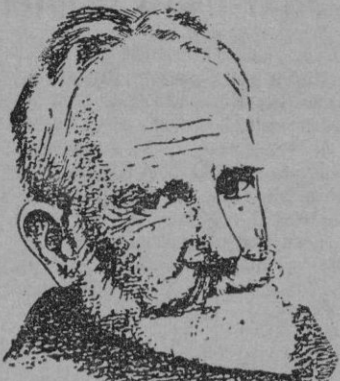
Toda la obra de Shaw está plagada de donosos insultos: «El inglés — dirá en alguna parte — lo hace todo por principio. Guerra por principios patrióticos, roba por principios comerciales, esclaviza por principios imperiales, intimida por principios viriles, mantiene a su rey por principios de lealtad y le corta la cabeza por principios republicanos. Su consigna es el deber. Y no olvida que está perdida la nación cuando deja al deber ponerse en contra de la conveniencia. Esto tiene cariz de mitin al aire libre; en cambio, en piñeta humorística, escribirá: «Los ingleses creen que irán al cielo si dan toda su fortuna a los pobres. Pero ninguno lo hace.» (Verdad es que el axioma puede ser aplicado lo mismo a los habitantes de Pall Mall que a los de Son Rapiña, por no ir más lejos a buscar gente adinerada y dispuesta a ir, por el camino más corto, al cielo).

Es curioso que los escritores de habla inglesa más populares entre nosotros sean todos, o casi todos, irlandeses. La cosa puede que sea una casualidad. Aquí tal casualidad no tiene grandes explicaciones de índole práctica. En Inglaterra — donde parece ser ocurre tres cuartos de lo mismo —, la enorme popularidad de George Bernard Shaw — entidad fundada en 1856, algunos años después que nuestro Ca'n Juan de S'Aigo — tiene una evidente y lógica explicación. Nadie ha fustigado con tanto salero a los ingleses, desde el libro, el periódico o la plaza pública como este ilustre barbado, que acaba o está a punto de cumplir los cincuenta años (como siempre los artistas no han sabido ponerse de acuerdo en los detalles exactos: unos señalan el 2 de Julio, otros el 26 como la fecha del nacimiento de Shaw. ¡Con lo fácil que hubiera podido acudir al Espasa y darle de veras y para siempre, confundida!).