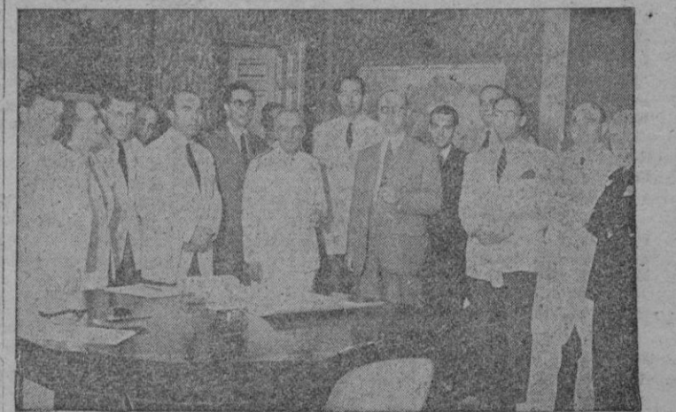
En la Presidencia del Gobierno se celebró el acto de entrega de los Premios Virgen del Carmen de Literatura y Periodismo