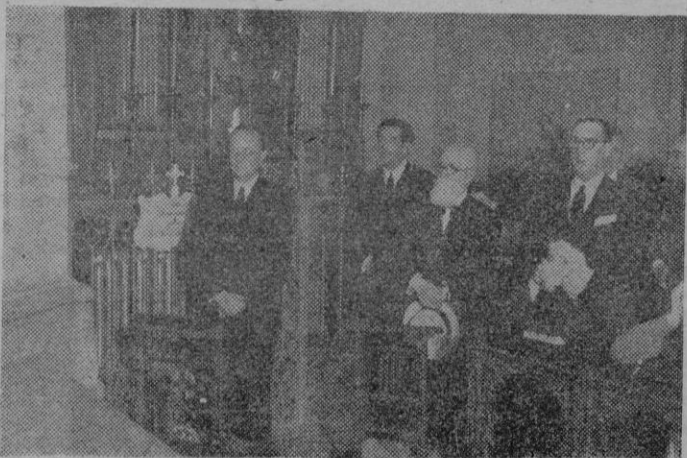
En la iglesia de San José se celebró una solemne misa por el alma de don José Calvo Sotelo, organizada por la Real Academia de Jurisprudencia presidida por el Ministro de Justicia don Raimundo Fernández Cuesta