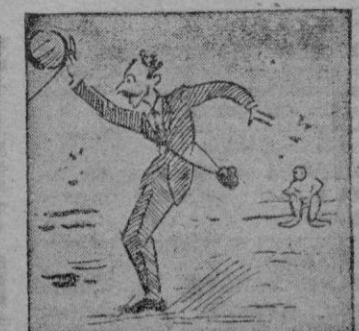
Y por entrambas ausencias ¿Quién pagó las consecuencias?

(Juanet, nuestro reporter gráfico, hizo una genial parada para salvaguardar su físico y su máquina.)