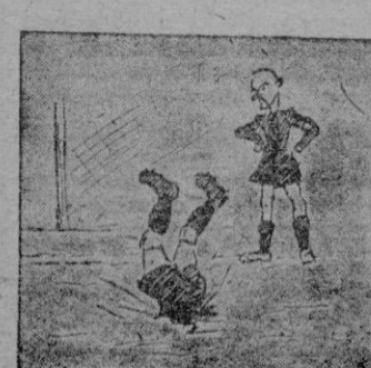
Y el portero poblensino siguió contrario camino.