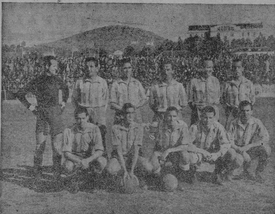
Este es el conjunto del C. D. Málaga, que tras una brillantísima campaña en su equipo de III División y ahora en la Fase Final, ha conquistado el inspirado ascenso a la Segunda División. El Málaga, es uno de los equipos nuevos que desfilará la próxima temporada (D. m.) por ES FORTI.