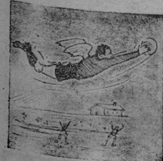
Benassar, ave ligera exploró la estratosfera