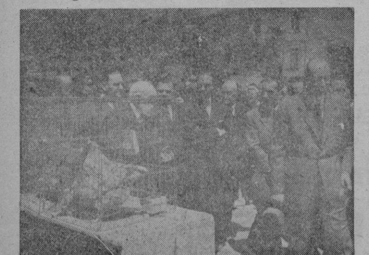
El Subsecretario de Agricultura con el Gobernador Civil de Barcelona y otras autoridades recorriendo la sección avícola de la Exposición de Ganados.