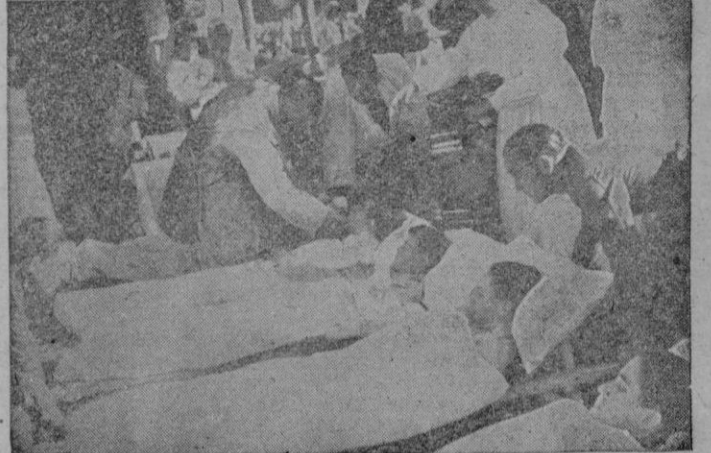
Los enfermos trasladados en camillas a la Avenida de Calvo Sotelo, en el momento de darles la comunión con motivo de la clausura del Congreso Eucarístico