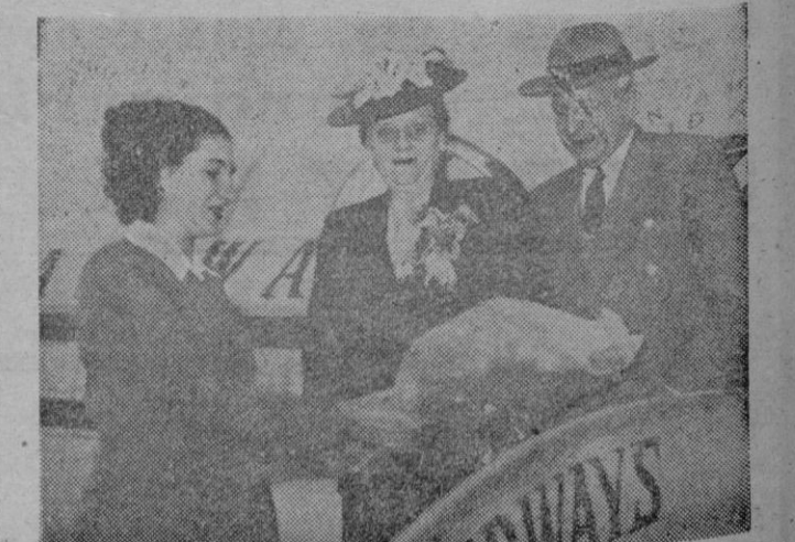
El señor George Messersmith, nuevo Embajador de los E.E. U.U. en Buenos Aires desciende del avión acompañado de su esposa al llegar a la capital del Plata.