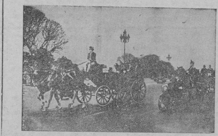
La Presentación de Credenciales de un embajador español constituye siempre en la Argentina un acontecimiento que resalta la fraternidad hispanoamericana. En la «foto» se ve al actual Embajador de España en Buenos Aires, dirigiéndose a la Casa Rosada para saludar al Presidente argentino. — (Foto Cifra).