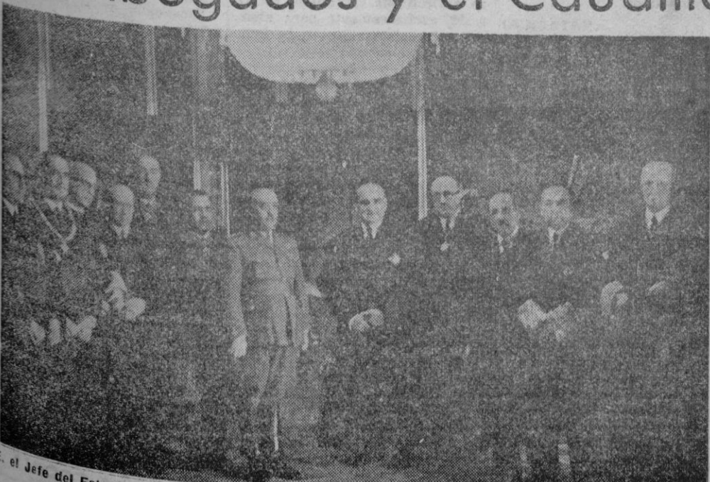
El Jefe del Estado recibió en El Pardo a una Comisión de los Colegios de Abogados de España presidida por don Antonio Goicoechea, que le reiteró su adhesión

Nuestro Gobierno invita a Gran Bretaña, EE. UU., Holanda, Egipto, Brasil y Australia para que envíen una comisión inspectora de técnicos