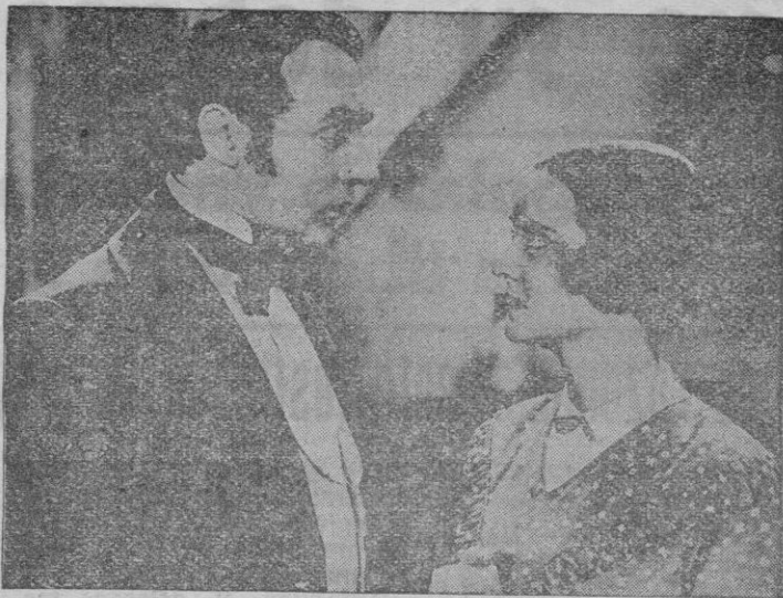
Bette Davis, con Charles Boyer, en una escena de la película «El cielo y tú»