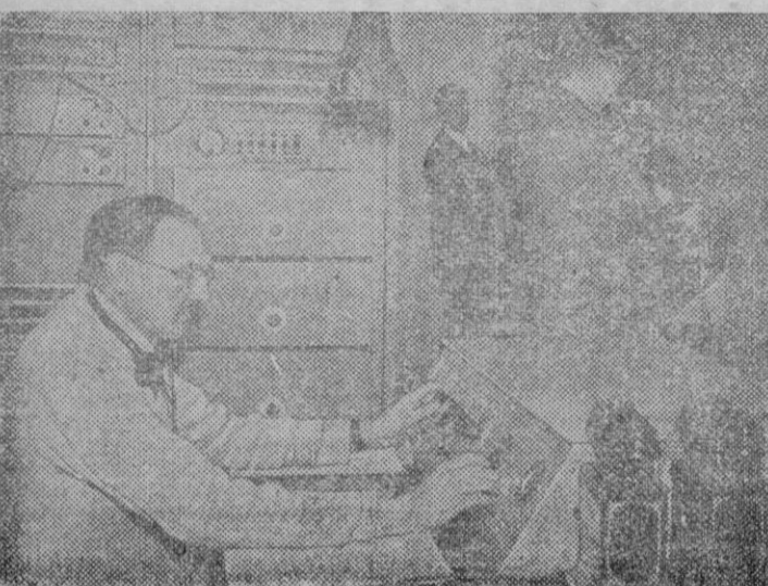
Vista parcial del Departamento transmisor de visualidad de televisión de la B.B.C. En primer plano, se ve la mesa de control.

Decorado exquisito. Presentación fastuosa «Manon» estuvo recordada de los mejores alientes AGUILO DE CACERES