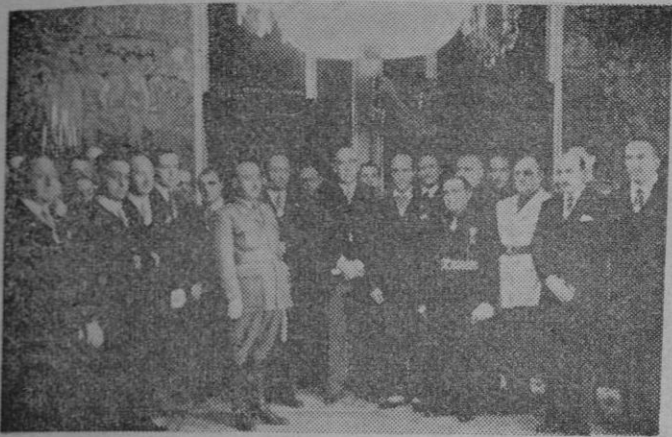
E. el Jefe del Estado recibe en audiencia extraordinaria al nuevo Ayuntamiento de Madrid