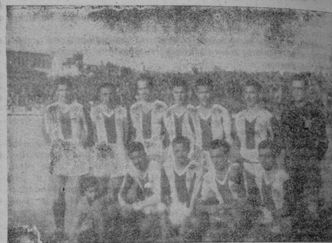
Equipo del Atlético-Baleares

Lo normal, en todas las competiciones futbolísticas, es que vengan los equipos que juegan en casa, y la palmen aquellos que