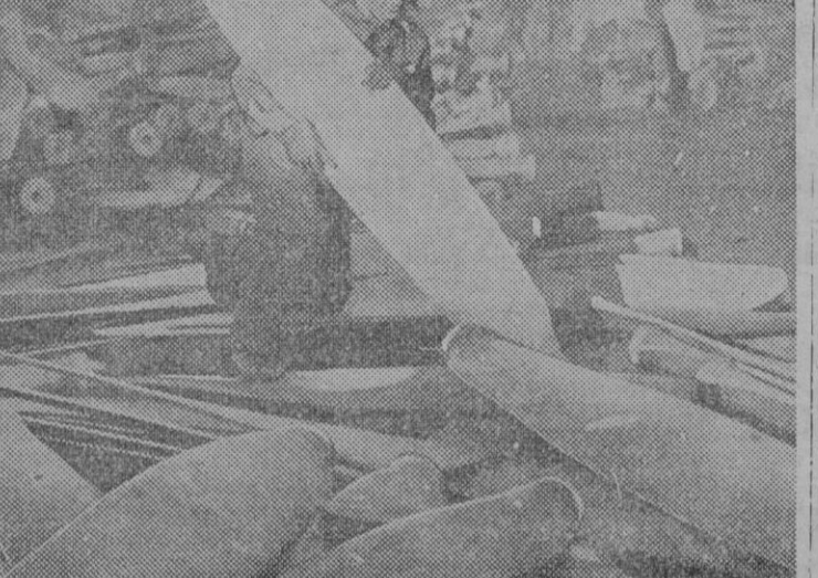
Las hélices de los aviones de bombardeo y cazas de la R. A. inutilizados para el servicio, sirven ahora convertidas, rápidamente, en magníficos utensilios de cocina, particularmente en soberbias y pacíficas cacerolas