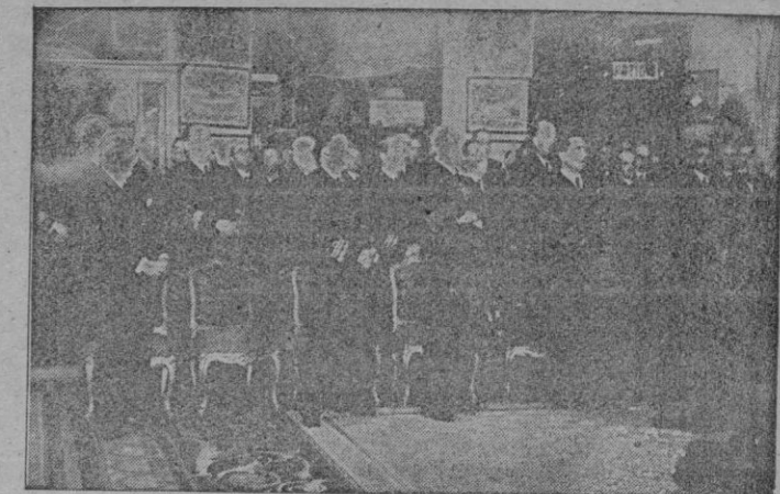
Madrid. — El Ministro de Marina preside la solemne ceremonia religiosa celebrada en el Ministerio en recuerdo de la gesta del «Baleares». — (Foto Cifra)