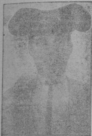
RAFAEL GUERRA «GUERRITA»

Lo leído y escuchado, nos hace tener una idea más o menos exacta de lo que fué Rafael Guerra Bejarano, el segundo Califa del toro.