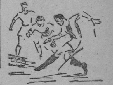
Brondo, en un espléndido tiro... que casi fué gol.