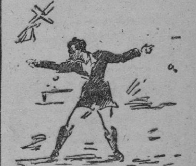
Bonet, el admirable árbitro mallorquín en una de sus características posturas.