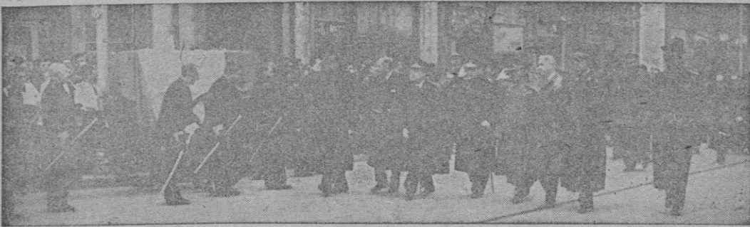
El Gobierno desfila ante el armón que contiene los restos del Teniente General Orgaz recientemente fallecido en Madrid.

"Somos lo bastante fuertes para no tener que mendigar de nadie nuestras libertades, nuestros derechos y nuestra manera de ser"