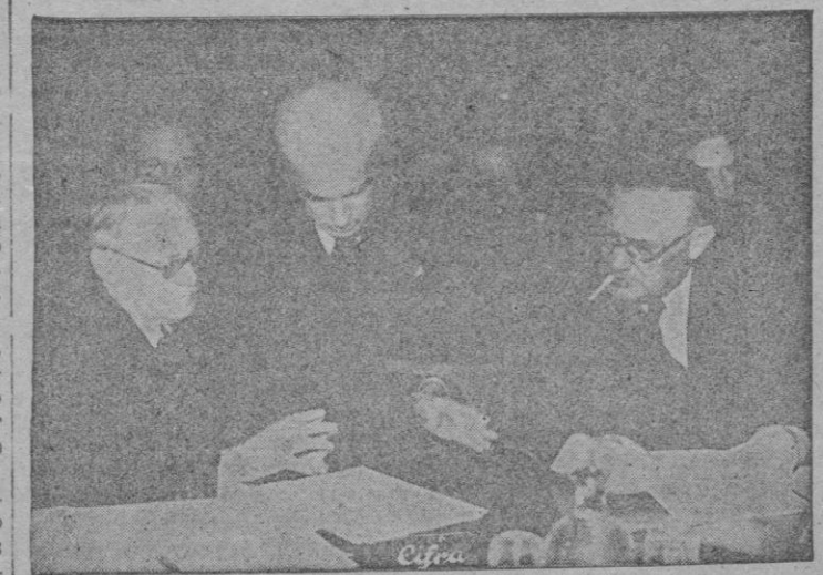
En esta foto aparecen los representantes de las tres grandes potencias en el Consejo de Seguridad cambiando impresiones, Bevin y Vichinsky, sentados, escuchan a Steettinius con atención

El discurso fué interrumpido en diversos pasajes con grandes ovaciones.—(Cifra).