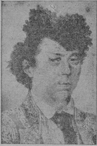
FRANCISCO ARJONA HERRERA «CUCHARÉS»

Cúchares fué alumno de la Real Escuela de Tauromaquia de Sevilla, a la edad de 12 años. Dicen los cronistas antiguos que el arte de Currito Arjona fué arbitrario y libre. No quiso amoldarse a las reglas establecidas por los Romero, Pepehillo y Paquiro. Su toreo, alegre y lleno de toda la gracia sevillana, fué suficiente para poder competir con su coetáneo Chiclanero, torero éste, serio y hecho dentro de las más clásicas normas. Decía «Cúchares», que para él, los toros eran un divertimento, y debía ser cierto, cuando apenas sufrió percances por cogidas de astados, a pesar de ser tan dilatada su actuación en los ruedos. En Madrid solo, llegó a estoquear 322 reses bravas. Aunque nació en Madrid, el 19 de mayo de 1818, le consideraron siempre sevillano, por haber sido criado en Sevilla. Nadie ha sabido explicar el origen de su apodo. En 1868 fué a la Habana contratado, pero no pudo actuar por fallecer poco tiempo después de su llegada allí. Murió del vómito negro el día 4 de diciembre de aquel mismo año.