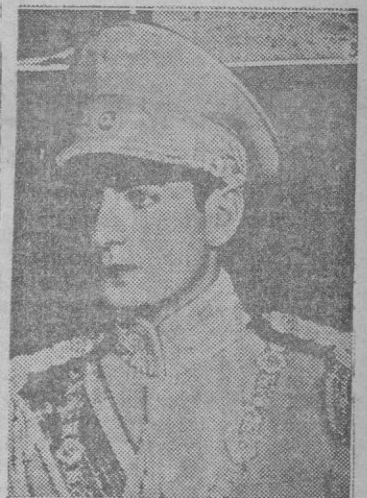
Sha Mohamed Riza, Soberano del Irán, país que ha presentado a la O.N.U. su difícil y peligrosa disputa con Rusia, que ha de poner a prueba la eficacia y solidez de esta nuevo Organismo Internacional