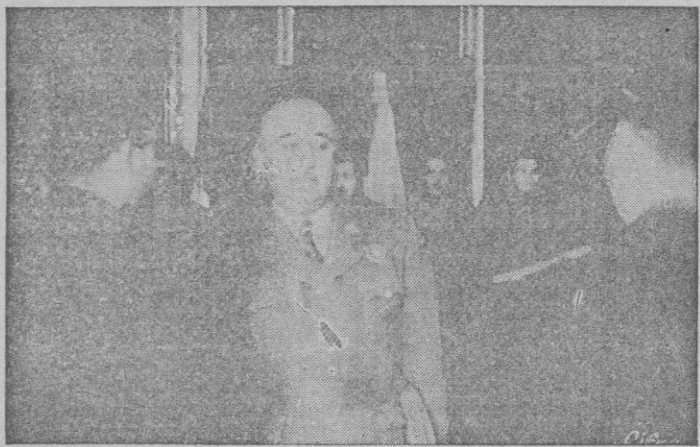
S. E. el Jefe del Estado recibe en el Palacio de El Pardo al Jefe Nacional del Sindicato Español Universitario y una representación de estudiantes de Madrid.