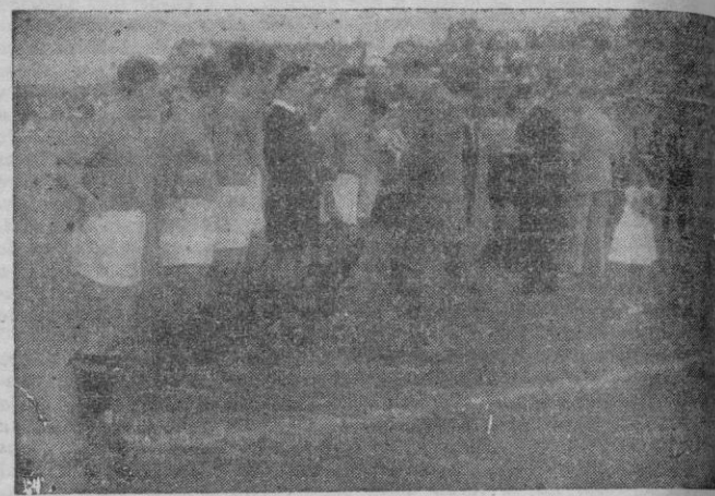
Los equipos del Xerez y del Mallorca recibiendo las medallas conmemorativas

Sigue el escrutinio, y esperamos que mañana podrá darse ya el número definitivo de ganadores entre los que serán sorteadas las 500 pts.