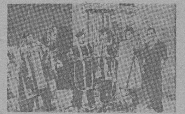
Burlas sacrílegas de los milicianos rojos

La flamante Constitución de la República instaurada en España el 14 de Abril de 1931, establecía con toda solemnidad, a bombo y platillos, como prueba rotunda de fervido amor a la libertad, la de conciencia en su artículo 27 y con ello se garantizaba plenamente, como es obvio, el derecho de profesar y practicar libremente cualquier religión. Desde la católica hasta el más grosero fetichismo, tenían vía libre en España, en virtud del avanzadísimo «espíritu» de los fautores de la «Carta» republicana que haría la felicidad de los españoles. Pero —siempre existe un pero— el infierno está empedrado de buenas intenciones, y así dando por «buena» la intención, la lógica fretepopulista exigía un desarrollo con los singulares métodos de nuestros republicanos; y así en virtud del artículo 26 que autorizaba la disolución de las Ordenes en ciertos casos — todos los casos — se disuelve la Compañía de Jesús, se incautan sus bienes y sigue la orgía, que dió principio con la quema de conventos para solemnizar el advenimiento de la República. Después de tan brillante principio, Azafra, en memorable discurso asegura que: España ha dejado de ser católica. Mas ajustado a la realidad fuera decir: Hacemos la vida imposible a los católicos» pero ello fuera obrar contra la lógica marxista, que exige decir una cosa para hacer todo lo contrario. «Libertad de cultos, de conciencia