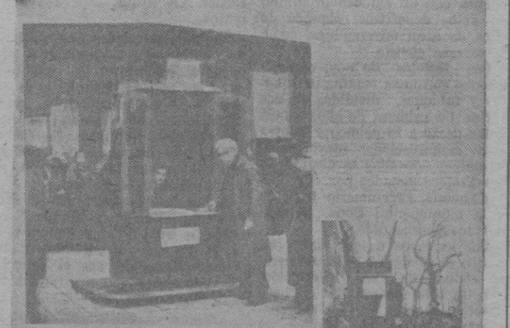
Los confesionarios en la calle

La flamante Constitución de la República instaurada en España el 14 de Abril de 1931, establecía con toda solemnidad, a bombo y platillos, como prueba rotunda de fervido amor a la libertad, la de conciencia en su artículo 27 y con ello se garantizaba plenamente, como es obvio, el derecho de profesar y practicar libremente cualquier religión. Desde la católica hasta el más grosero fetichismo, tenían vía libre en España, en virtud del avanzadísimo «espíritu» de los fautores de la «Carta» republicana que haría la felicidad de los españoles. Pero —siempre existe un pero— el infierno está empedrado de buenas intenciones, y así dando por «buena» la intención, la lógica fretepopulista exigía un desarrollo con los singulares métodos de nuestros republicanos; y así en virtud del artículo 26 que autorizaba la disolución de las Ordenes en ciertos casos — todos los casos — se disuelve la Compañía de Jesús, se incautan sus bienes y sigue la orgía, que dió principio con la quema de conventos para solemnizar el advenimiento de la República. Después de tan brillante principio, Azafra, en memorable discurso asegura que: España ha dejado de ser católica. Mas ajustado a la realidad fuera decir: Hacemos la vida imposible a los católicos» pero ello fuera obrar contra la lógica marxista, que exige decir una cosa para hacer todo lo contrario. «Libertad de cultos, de conciencia