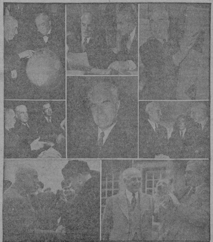
El Sr. Edward R. Stettinius Jr., ex Secretario de Estado y presidente de la organización de las Naciones Unidas, en varios momentos de su vida política, acompañado de Eden, Molotov, Cordell Hull y otras ilustres figuras internacionales