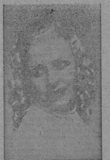
Canzonetista, que también toma parte en el Jueves de Moda que se celebra esta noche en el salón de Te. Madrigal.