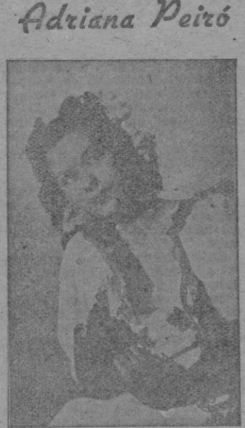
La gentil canzonetista de aires regionales que esta noche hará su presentación en los salones de Madrigal, con motivo de celebrarse el Jueves de Moda.