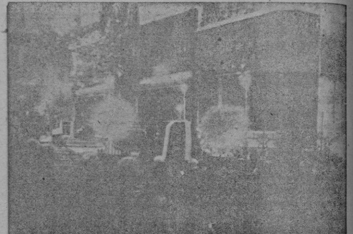
Momentos de celebrarse el solemne oficio funeral