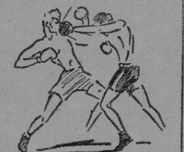
Peña recibe en pleno rostro un buen directo de Cucurell