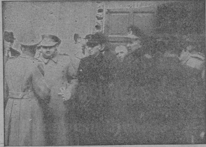
Autoridades que concurrieron al funeral en sufragio del Capitán General del Departamento del Ferrol del Caudillo