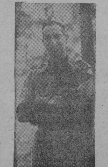
Una reciente fotografía del Teniente General Clark, obtenida en un lugar del frente italiano