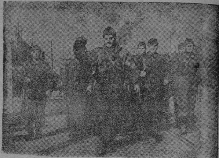
En la fotografía vemos un grupo de paracaidistas húngaros, marchando por una calle de Budapest en dirección a las líneas de fuego