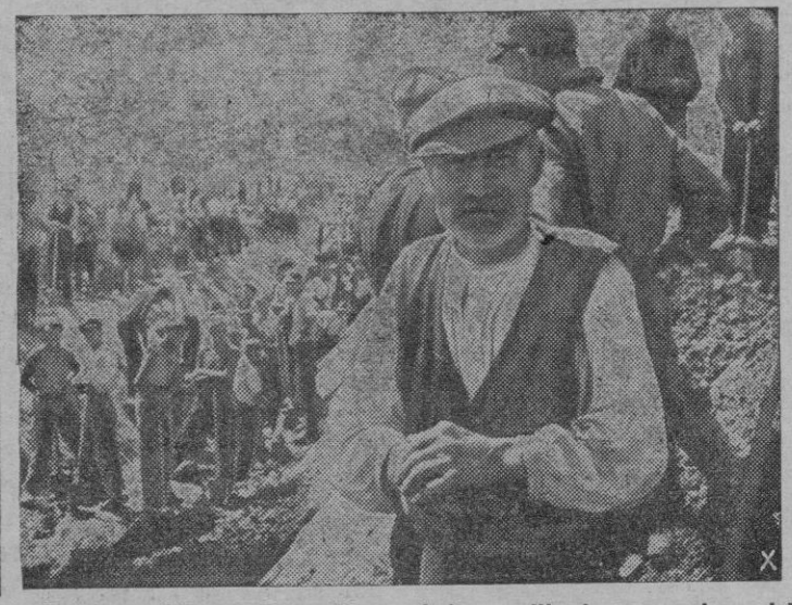
Todo el pueblo prusiano ha quedado movilizado por orden del Fuhrer, para construir fortificaciones de contención del avance soviético