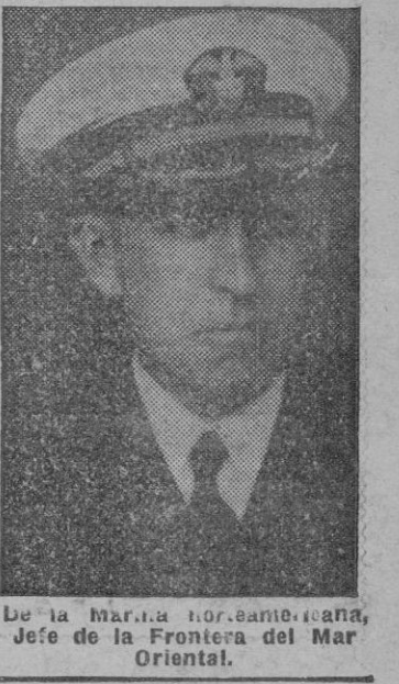
De la Marina Norteamericana, Jefe de la Frontera del Mar Oriental.