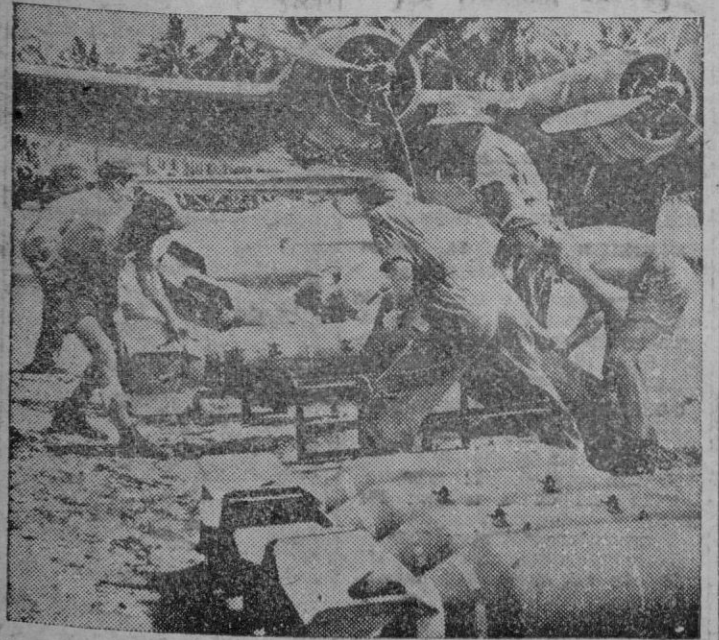
El equipo de tierra de una Fuerza Aérea de los E. U. cargando un gran bombardero americano en una base del Pacífico Sur.