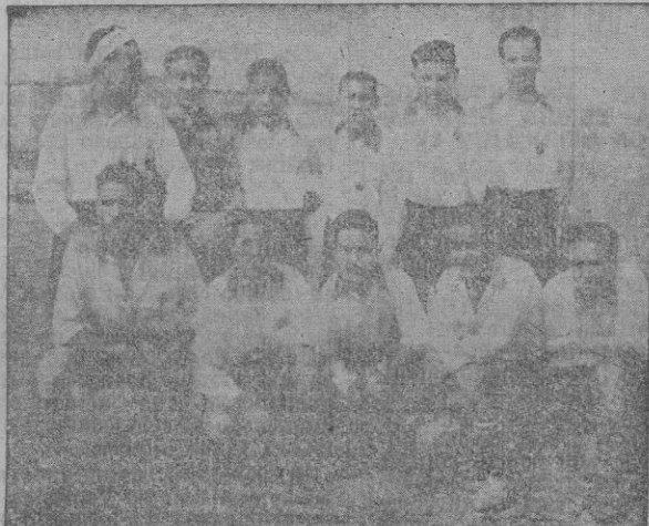
Equipo del Liceo, Campeón de Palma en el Torneo del F. de J.

campo de deportes y a la vez que de los físicos, se cuidaba de lo moral e intelectual pues varios de los campeones pueden ostentar también Matrícula de Honor en sus tareas escolares confirmando la realidad del citado «Club». Gran parte de su éxito, corres-