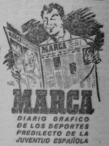
DIARIO GRAFICO DE LOS DEPORTES PREDILECTO DE LA JUVENTUD ESPAÑOLA

Antes de iniciar los expedicionarios el regreso a Palma, se vitereó al Mallorca y Alaró. El acto resultó simpatísimos.