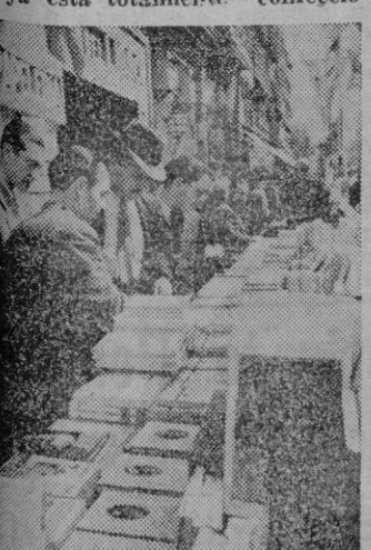
Los editores catalanes participan en la Feria Nacional del Libro como exponente de una labor meritoria que antes se reflejaba en las Ferias celebradas en Barcelona.

Como no podía ser por menos, el concepto de neutralidad ha desbaratado ya la maniobra que pudo iniciarse. Y suprimidos los «ismos» no cabrán dentro de ellos los aprovechamientos traidores de las simpatías particulares. Vemos que una vez más las logias «pasaron de tiempo».