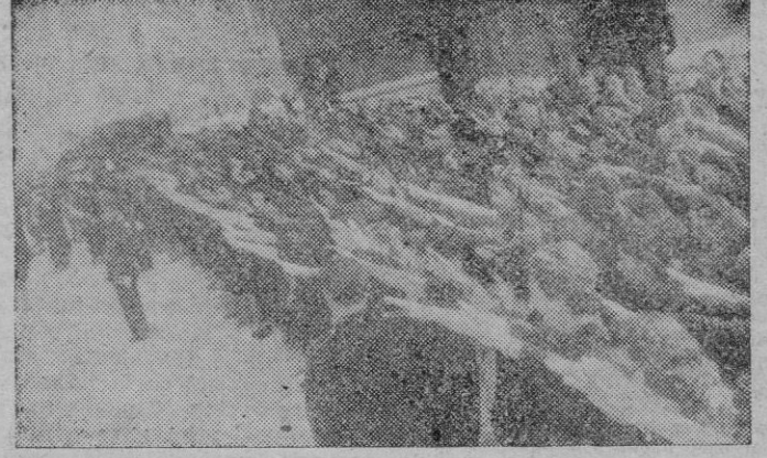
Momento en que las camaradas de la Sección Femenina entonan el «Cara al sol».