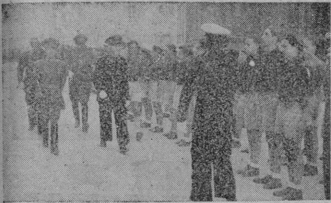
El Excmo. Sr. Gobernador Civil y Jefe provincial del Movimiento revisando las fuerzas que formaron durante la ceremonia.