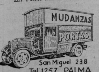
San Miguel 238 Tel. 1257 PALMA

nado e programa de actos que durante ella han de celebrarse. Todos los días, a partir del 31 de mayo al seis de junio, tendrán lugar, a las cuatro de la tarde, y algunos días también por la mañana, las discusiones de los distintos temas que han de tratarse. Estos temas, cuya puntualización está en estudio serán desarrollados por ponentes que a tiempo se designarán. En principio, los temas versarán sobre las siguientes ideas: Unidad del habla española; perspectivas internacionales de la literatura española; la personalidad del escritor y su dignificación profesional; la Propiedad intelectual; Derechos y deberes del editor; Di-