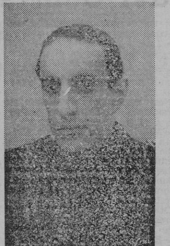
El Presidente del Instituto del Libro, camarada Julián Pemartín.

Estos datos que hemos recogido respecto a la próxima celebración de la Feria del Libro y Asamblea del Libro español, que promete resultar muy interesante, en cuanto pueden ser fiel exponente de los aciertos del Nuevo Estado, median-