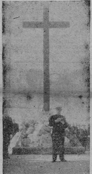
El Excmo. Sr. Gobernador Civil y Jefe provincial del Movimiento leyendo el Decreto de Unificación.

Vitoria. — Con motivo de la fiesta de la Unificación se ha ce-