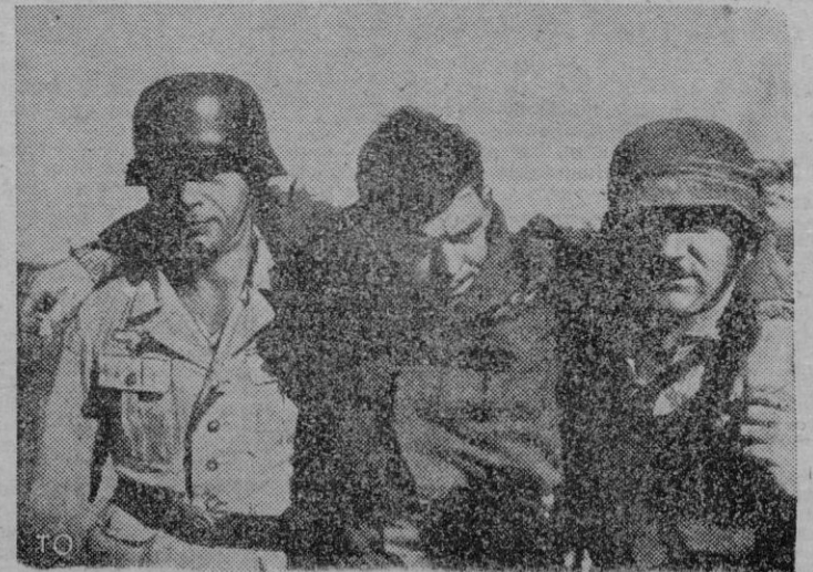
Al efectuar una incursión sobre una isla ocupada por las tropas alemanas en el Egeo, fué derribado el aparato de este aviador norteamericano, el cual cayó herido. Lo vemos en esta foto en el momento de ser conducido por dos soldados alemanes a un puesto sanitario.