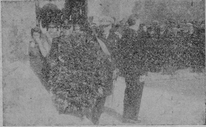
Los Excmos. Sres. Almirante y Jefe Provincial del Movimiento depositando una corona al pie de la Cruz de los Caídos.