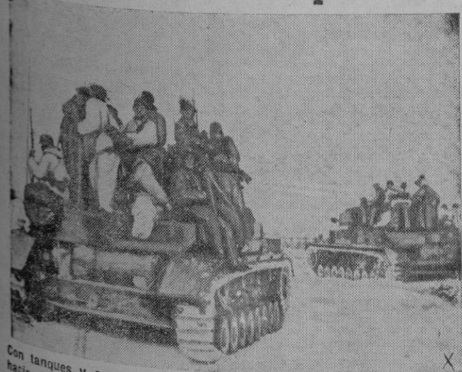
Con tanques y carros de combate, granaderos alemanes se dirigen hacia el objetivo señalado que tras dura lucha caerá en sus manos.