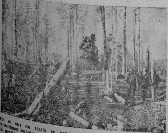
En el sur de Italia se combate encarnizadamente. Hermosos y frondosos bosques italianos van desapareciendo bajo la metralla de la artillería pesada de ambos contendientes. He aquí una instantánea de la lucha en un bosque