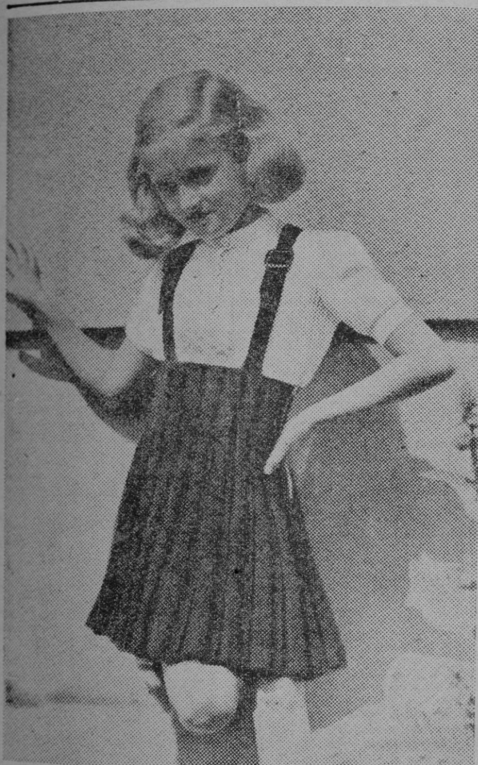
Un bello modelo para niña, ejecutado totalmente en punto de lana, blanco y negro

Desde hace varios años, la moda se «feminiza» —si cabe decirlo así— lentamente. Y ahora, en esta temporada de invierno 1943-44, llega a hacerse ligera y graciosa merced a las mangas raglan, a los empiezos y, sobre todo, a las mangas kimono, que gozan del favor y predilección de los grandes modistos. En todas las colecciones recientemente presentadas existe acerca de este punto perfecta unanimidad y se han visto modelos de vestidos de mañana, de tarde, de deporte, abrigos e impermeables con mangas de esta clase.