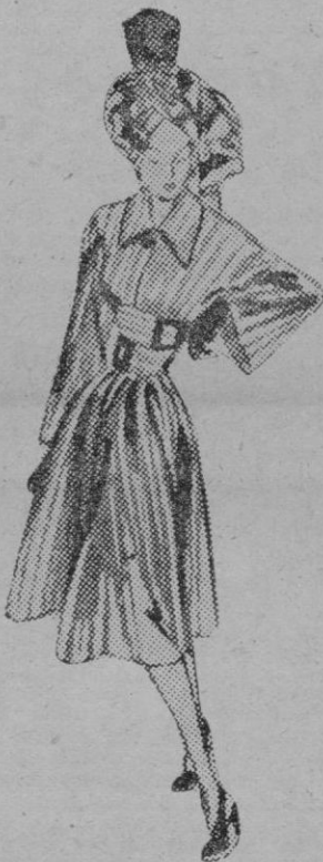
Aun dentro de las limitaciones que la estabilidad de la moda actualmente impone, este modelo ofrece una cierta originalidad. Su tónica general es, sin embargo, la de todos los conjuntos modernos: talle ceñido, vuelo en la falda, que se frunce en la cintura, y turbante que armoniza con el resto de la indumentaria

La mayoría de ellos son turbantes, gorras, boinas y aureolas, en cuya confección se emplea mucho el fieltro, el terciopelo, las plumas y los tulés y que protegen muy bien el peinado, al tiempo que dan al rostro un aire juvenil.