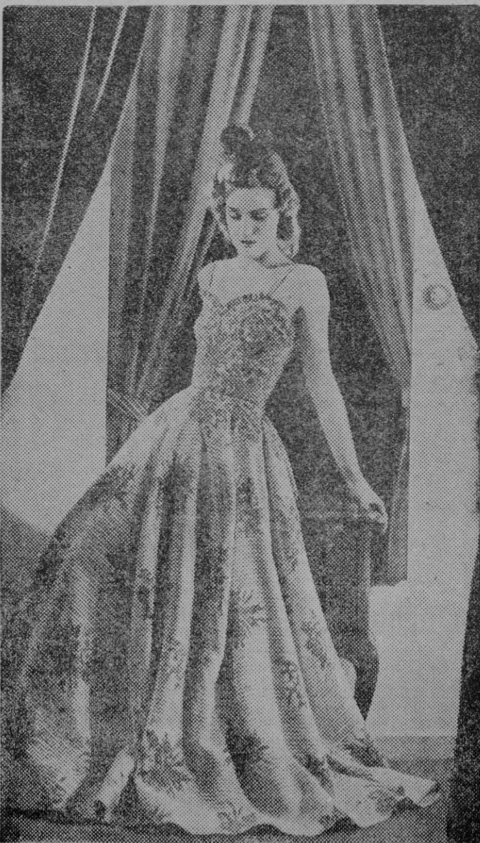
Un lindo modelo de traje de noche ejecutado en rico tejido rameado, con corpiño ajustado y falda de amplio vuelo. Los tirantes van cutados de brillantitos de fantasía