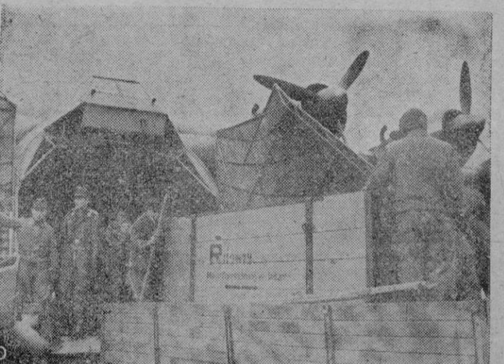
He aquí un avión de transporte alemán del nuevo modelo gigante «Me 323», cargando motores de aviones con destino al sector sur del frente del Este