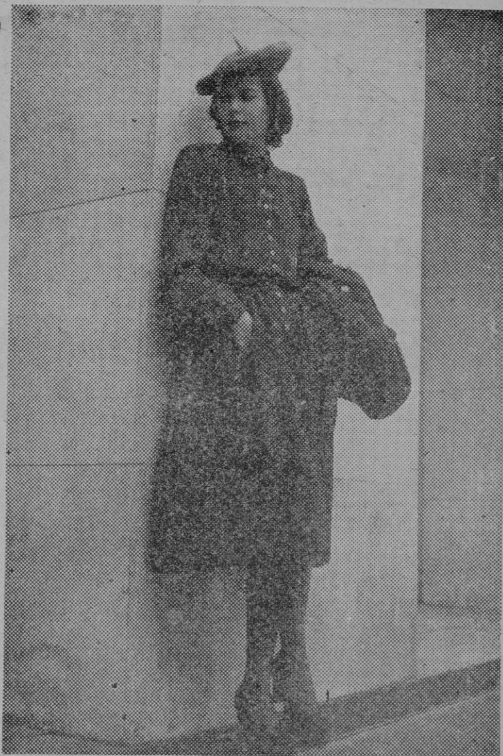
Traje de lana color marrón. Abrigo suelto con cinturón ancho