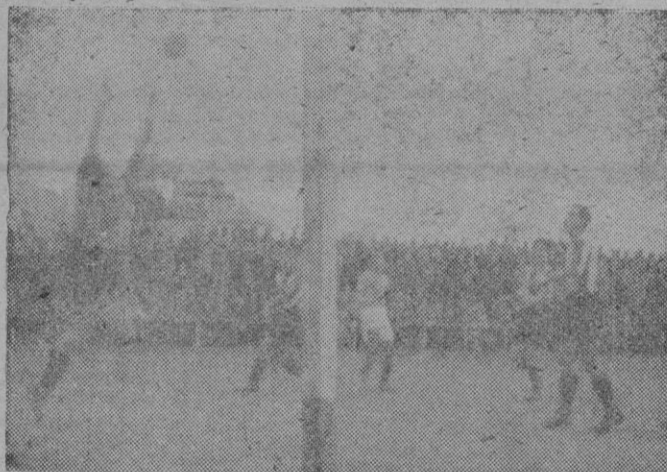
No fué tanto pero pudo serlo...

Si hubiéramos apuntado los saques de esquina contra los visi-