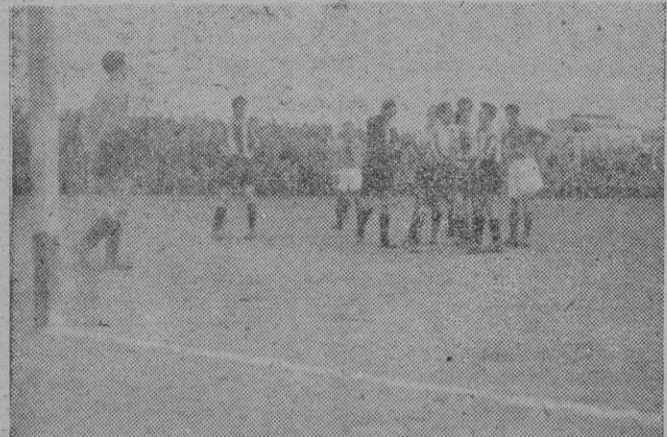
Llinás, demuestra su autoridad, expulsando del terreno de juego a Vilgrau, por su actitud poco correcta para con él y para con el público.