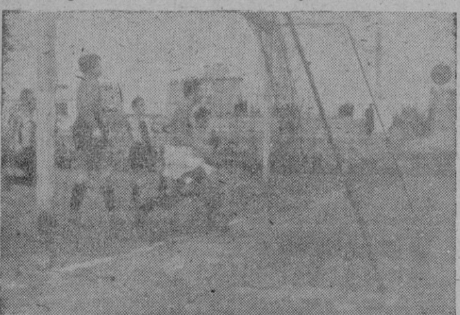
El cuarto tanto del Atlético Baleares.

disimo del 6-0. Este tanteo exagerado, fué lógico, pues en los visitantes no se yió nada en absoluto que valiera la pena. Solo la