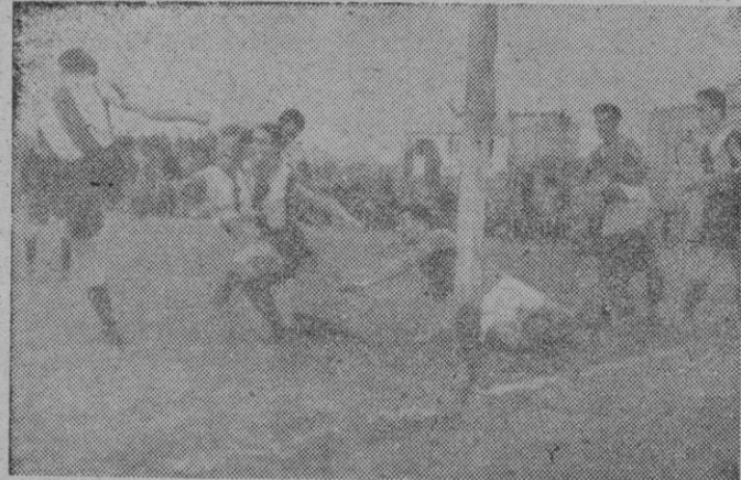
Y el sexto...

Un remate de Riera a una parada de Carberol, producida por un tiro fuerte de Oliva, se convirtió en el primer tanto de la tarde, llevándose 35 minutos de juego.