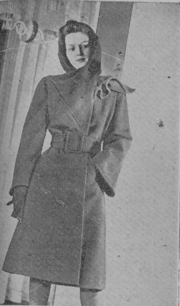
Modelo de gran novedad es este abrigo en forma de campana con capucha recortada