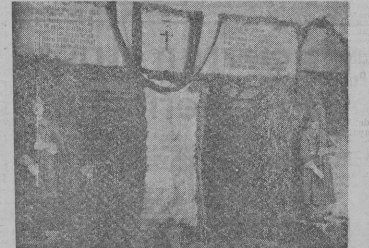
Entrada al local que ocupa la tercera Compañía, cuyo adorno fue premiado con el máximo galardón, en el concurso organizado en el Cuartel del Campen, con motivo de la fiesta de la Patrona.