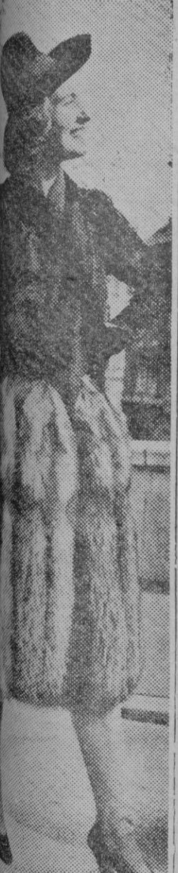
Modelo de gran novedad es este abrigo en forma de campana con capucha recortada

El Frente de Juventudes hace su cuestación anual el domingo día 12. El solicitar tu óbolo una muchacha no la rechaces.