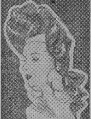
Continúan los turbantes a la orden del día. Tienen gracia componen buenos conjuntos y se adaptan a las más variadas indumentarias. Y sobre todas estas ventajas ofrecen una de incomparable valor: pueden hacerse con aquellos retales que considerabais casi inservibles. Este, por ejemplo, está realizado con un retal de lana escocesa

Píquense las cebollas, pónganse en una cacerola con 30 gramos de mantequilla, cuézanse suavemente hasta dorarlas, deslíense con agua hirviendo, agréguense las judías escurridas y la calabaza picada; hírvase espumoso, tápese y déjese cocer el conjunto hasta que esté muy tierno. Pásese por el colador apretando para que pase todo. Cuézanse los fideos en agua y sal durante diez minutos; agréguese al puré. Si resulta espeso, adelgácese con un poco de agua. Rectifíquese la sal, añádanse los cubitos de caldo triturados con una cucharita y disueltos en un poco de agua. Afáñese el resto de la mantequilla y muévase con una cucharita para ligarla. Sírvasse.