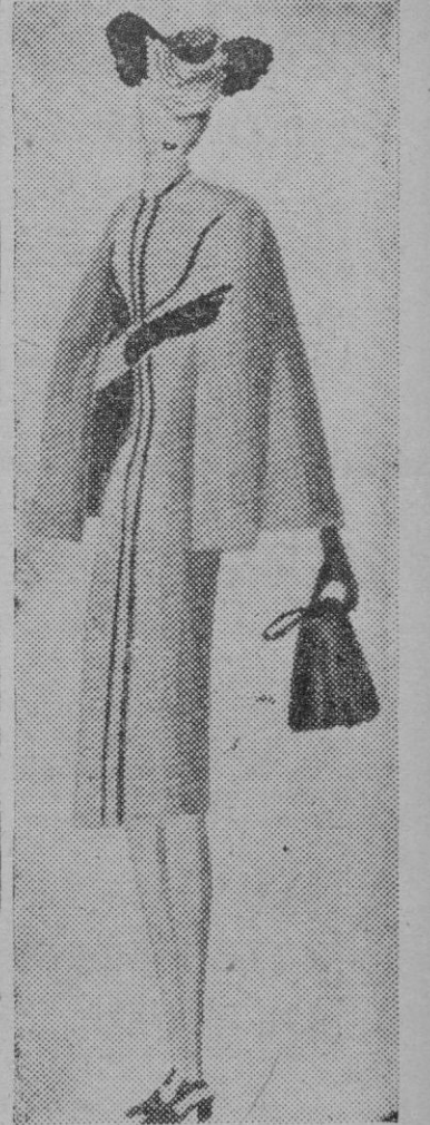
He aquí un elegante modelo. La capa que llega hasta la cadera, va prendida desde el cuello, adaptándose perfectamente a los hombros.

Trabar la mezcla a la lumbre, moviéndola. Apartarla cuando esté a punto, incorporándole otra porción de aceite, alternando con el zumo de limón.