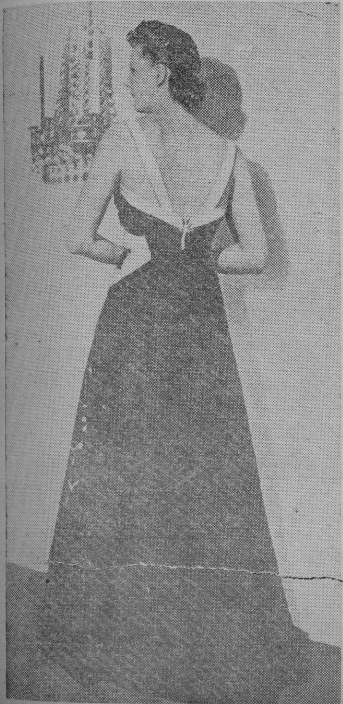
Elegante vestido de noche, que presenta ideas muy nuevas: la falda, amplísima, se compone de grandes pétalos y hojas recortados de taffetas negro aplicados sobre tul también negro, mientras el corpiño en taffetas blanco y negro ostentan un original efecto de corsé en el dorso, donde se prende