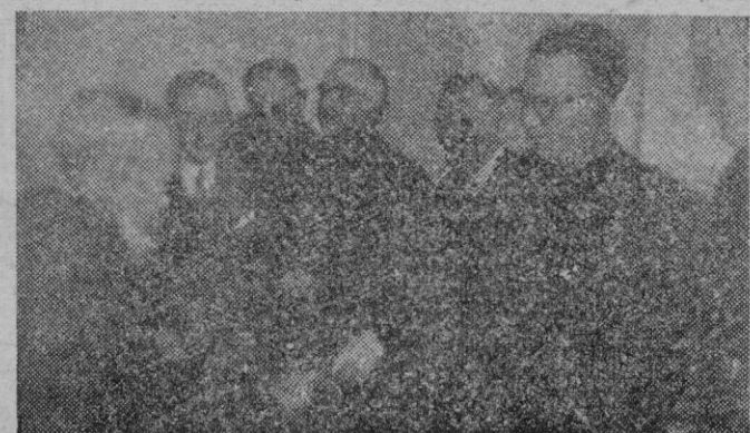
Momento de entregar, el Gobernador y Jefe Provincial del Movimiento, un título (VEA INFORMACION EN PAGINA 7ª)