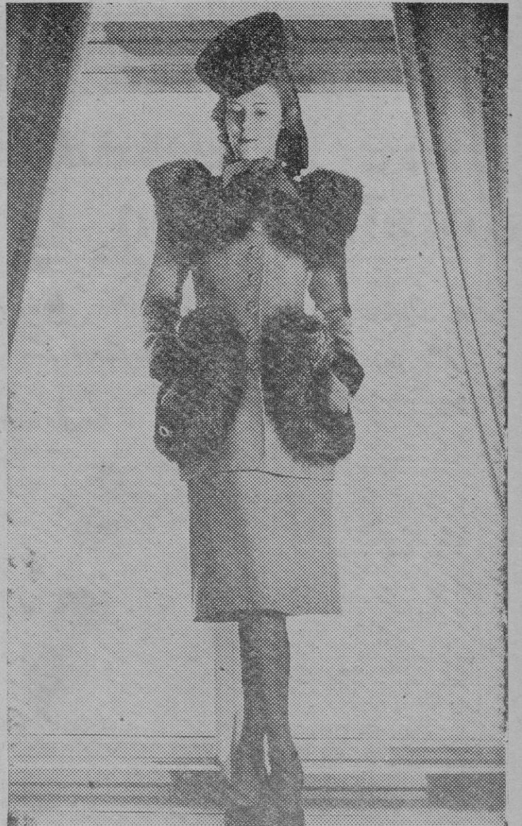
Nota muy acusada de la moda otoñal e invernal de este año, es el adorno de piel en torno a los bolsillos y a modo de hombreras o parches en la parte alta del delantero