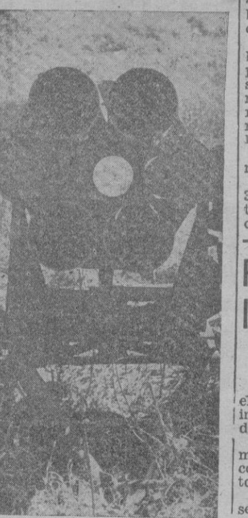
Esta foto curiosa nos muestra la temible arma nueva del Ejército alemán, el lanza-llamas múltiple

Birmingham. — En Alabama a causa de la escasez de carbón producida por la huelga que han declarado 20.000 mineros, las fábricas «CERO» producen menos que las de Teunese.