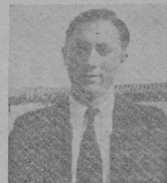
El Presidente del Poblense