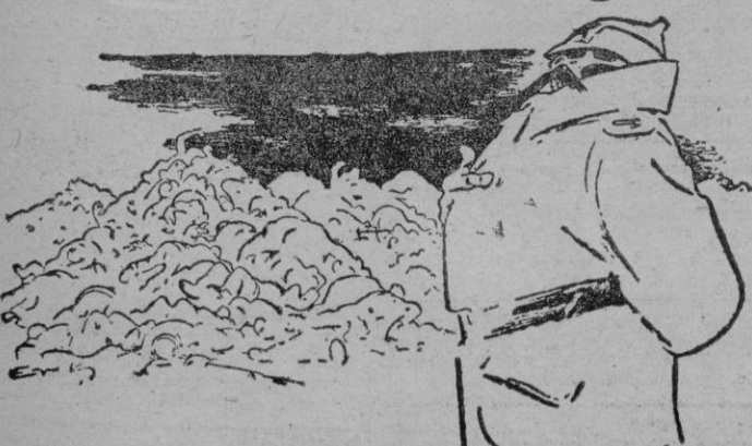
Aunque no conquistemos el trigo ucraniano, resolvemos en cierto modo el problema alimenticio...» (De «Das Reich».)