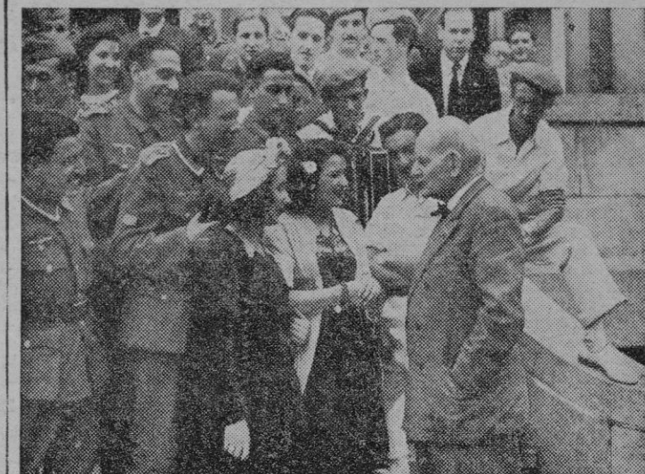
El Presidente del Instituto Ibero-Americano de Berlín dió recientemente una fiesta en honor de un grupo de heridos de la División española de voluntarios, asistiendo algunos artistas españoles que se encuentran camino hacia el Este.

En la foto vemos al Presidente Sr. Von Faupel conversar con todos ellos.