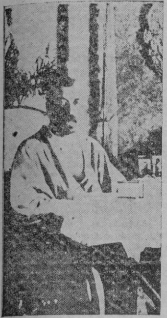
Ultima fotografía del Zar, hecha por la Zarina

Acaba de celebrarse el veinticinco aniversario del horrible atentado contra la familia imperial rusa, que marcó el principio de la peste roja, con todas sus crueldades y barbarismos, no interrumpidos, dentro y fuera del pueblo moscovita.