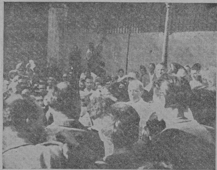
S. S. el Papa Pío XII, recorre los lugares damnificados en la incursión anglonorteamericana sobre la Ciudad Eterna.