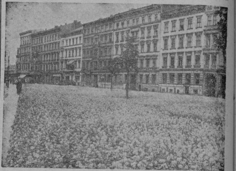
La ciudad de Berlin ayuda a ganar la guerra. En cuantos sitios ha sido posible se ha aprovechado el terreno para hacer plantaciones de hortalizas y frutas. Así vemos lo que antes era un paseo convertido hoy en huerta

Aliados Cuartel General Aliado de Africa del Norte.—Oficialmente se comunica que «las fuerzas alemanas han empezado a evacuar Sicilia». (Efe).