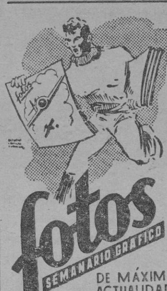
SEMANARIO GRAFICO DE MÁXIMA ACTUALIDAD