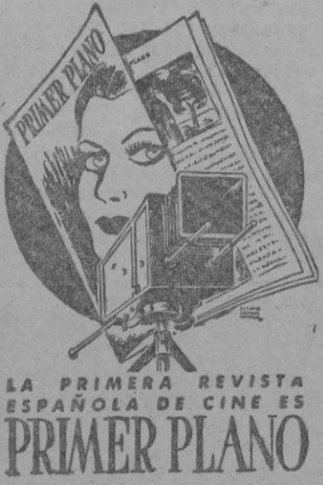
LA PRIMERA REVISTA ESPAÑOLA DE CINE ES PRIMER PLANO

Para el próximo miércoles se anuncia un programa cumbre nacional, en el que nos serán presentadas las formidables producciones «Madre Guapa» y «Los ladrones somos gente honrada», los mayores triunfos de la Cifesa.