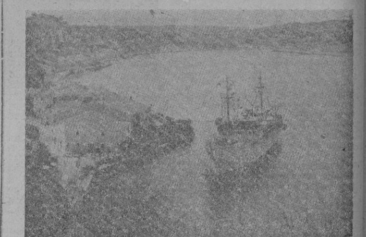
El puerto de Mahón

ciudades. No abundan, sin embargo. El más característico es sin duda el de Mahón. De celebrado y magnífico lo califican los historiadores. Para la ciudad no rezan los mismos elogios. Desde las