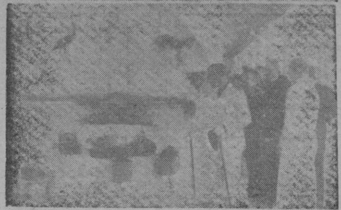
Diversos aspectos de la inauguración de la I Feria de Muestras. En la foto superior, el Delegado Provincial de Sindicatos leyendo su discurso. En las otras dos, nuestras autoridades durante su detenida visita a las instalaciones