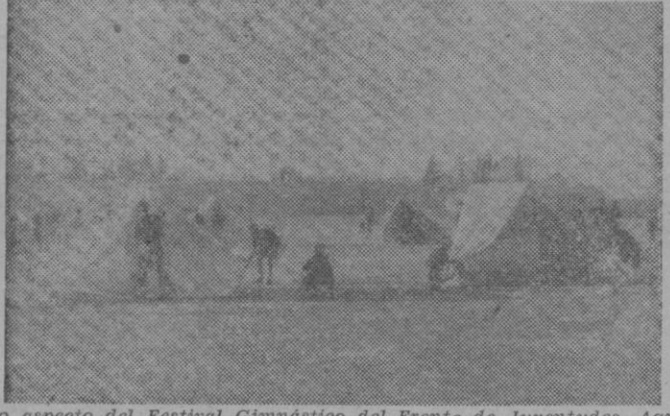
Otro aspecto del Festival Gimnástico del Frente de Juventudes. Aquí vemos como se efectúa la instalación rápida de un campamento, y como con facilidad pasmosa resuelven nuestros pequeños camaradas la cuestión complicada de la colocación de tiendas de campaña