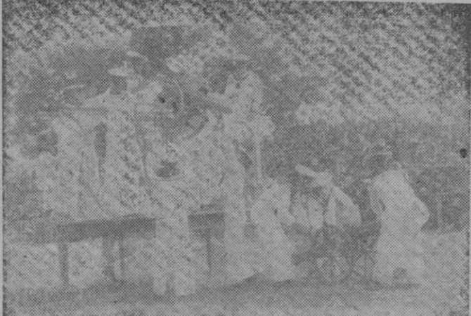
Con rapidez y precisión realizan aquí los Flechas Navales unos movimientos de práctica militar que merecieron los más cálidos aplausos