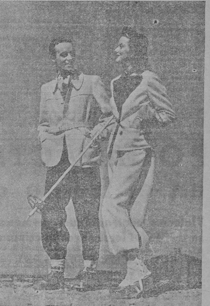
Para deportes invernales, los creadores de la moda lanzan ahora modelos que guardan cierta semejanza con los vestidos deportivos de calle. Claro que sólo en cuanto a chaquetillas y cuerpos. El presente modelo en lana blanca se compone de un pantalón con mucho vuelo y una chaquetilla corta y entallada. Lleva amplias solapas oscuras y se adorna con una trenzilla del mismo color