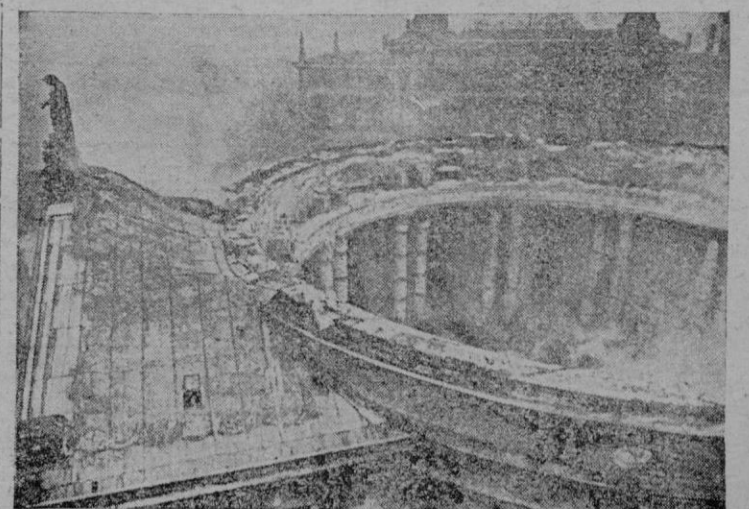
He aquí lo que ha quedado de la Catedral de Santa Eulogia, después de un bombardeo terrorista efectuado por las fuerzas aéreas norteamericanas