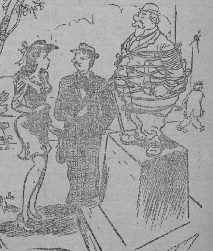
—Es que cuando lo hicieron la estatua, no se estaba nunca quieto.