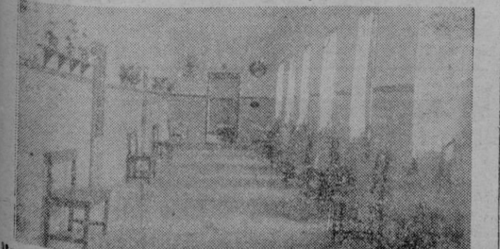
Una sala del Hogar Guardería de Muro. Lea en páginas interiores la información del acto celebrado el domingo