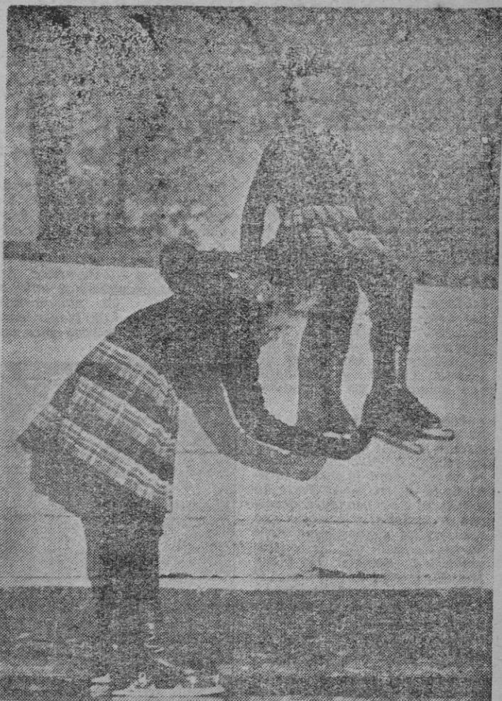
Estas lindas criaturas lucen unos graciosos trajes deportivos, conjuntos de jersey y medias de punto azul marino y falda escocesa plisada

LONDRES. — Más de 800 toneladas de bombas fueron arrojadas por los aviones británicos sobre Berlín durante la noche del sábado al domingo. Añádense que en las operaciones tomaron parte cuatrimotores de todos los tipos. — Efe.