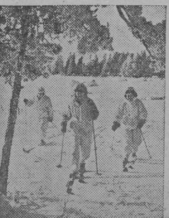
Lotas finlandesas se ejercitan durante su tiempo libre en el esquí.