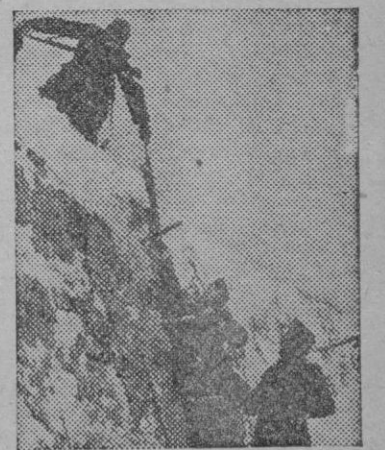
Los soldados alemanes son provistos de instrumentos de alpinismo para salvar la aspereza del terreno y lo riguroso del clima.