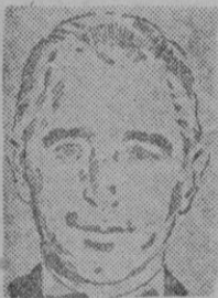
J. A. RIOS

Juan Antonio Ríos mantuvo hasta ahora una postura antinorteamericana. «Solidaridad con otras repúblicas suramericanas? ¿Presión de intereses poderosos? Recordemos a propósito que hace pocos días regresó a Santiago de su viaje a los Estados Unidos y Brasil el Ministro