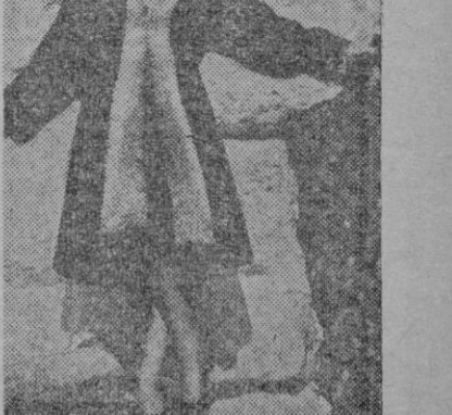
Este abrigo de gran novedad, conserva su línea de corte suelto, a la par que el broche sobre el pecho coadyuva al efecto ligeramente entallado de la prenda. El adorno está constituido por una banda de piel blanca que rodea el cuello y desciende hasta el borde del abrigo.

Se calienta al baño María y se sirve con cortezones fritos.