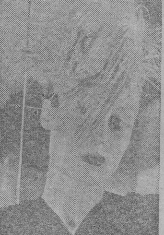
He aquí un elegantísimo modelo cuyo adorno está constituido por airosas plumas de avestruz arrojadas con gran soltura.