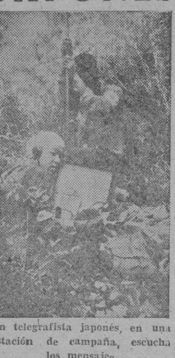
Un telegrafista japonés, en una estación de campaña, escucha los mensajes.