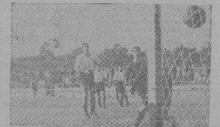
Uno de los tantos del Mallorca en el segundo tiempo que López no evitó... porque lo tuvo su día

7.º (Constancia). Freekick tirado por Hernández al pie de Antolín con rápida desviación de este