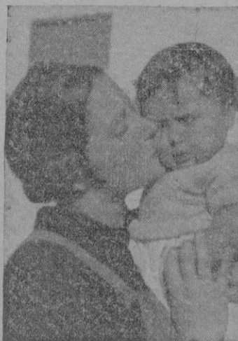
na, y si únicamente a la de vacunación antidiftérica, el mejor testimonio y la más clara prueba de su labor está en las elo-

honroso encargo que el Caudillo les hiciera. Sin referirnos en este trabajo a otras importantes campañas realizadas por las camaradas de la Sección Femenina