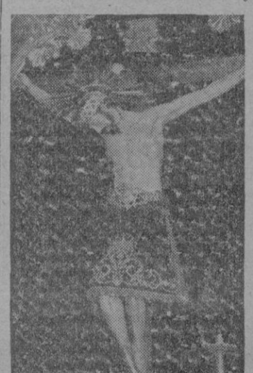
Venerada Imagen del Santo Cristo de los Navegantes de grandísima devoción entre los habitantes de la marinera barriada.

Tras de la imagen del Santo Cristo de los Navegantes iban los representantes de las nobles familias Ferrer de Sant Jordi y