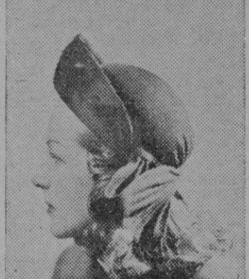
Sombrero de paja azul brillante, con lanzada de ciré

Hay que recordar que una alimentación bien equilibrada debe suministrar vitaminas al organismo. Para ello se tomará a diario una ensalada a base de lechuga, pepinos, tomates, etc. También hay muchas verduras que pueden tomarse crudas: zanahorias, coliflor, rábanos, aplo. Por último, no hay que olvidar que la fruta cruda es uno de los alimentos más ricos en vitaminas.