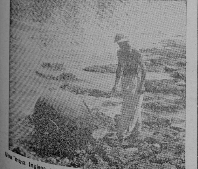
Una mina inglesa a la deriva llega a una playa del litoral libio, cerca de Tobruk.