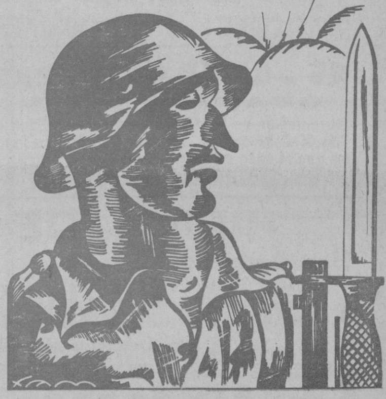
Los que trajeron la VICTORIA

Ellos hicieron posible la realidad emocionante del Día de la Victoria.