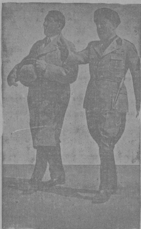
Turquía era un centro de atracción.

También se afirma que Hitler y Mussolini puntualizaron un nuevo plan europeo en el que