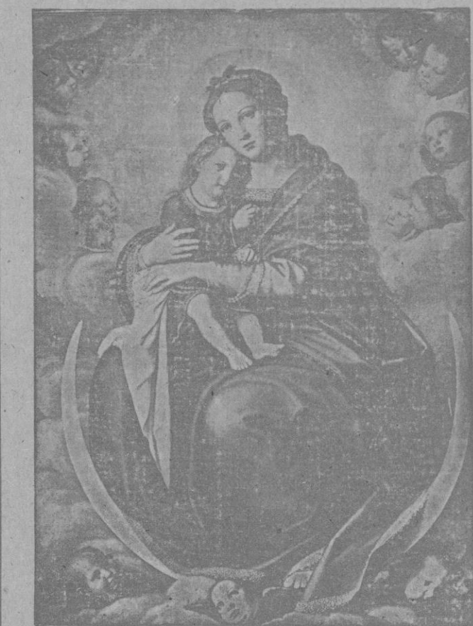
La Purísima Concepción, Patrona de España

«2.º Si Rusia consiguiere conquistar Finlandia entera, no habrá fuerza humana que le impida anexionarse parte del territorio noruego. Y el que Petsamo sea de Rusia es una cuestión que no puede dejar de interesar fuertemente a Inglaterra, pues dada la intimidad de relaciones germano-rusas, no ha de ser imposible que sus puertos estén a la disposición de los submarinos alemanes. Y como Petsamo está libre de hielo durante todo el año, los submarinos alemanes operantes en aquellas aguas, podrían inmortalizarse gravemente el tráfico británico en el Atlántico septentrional.»