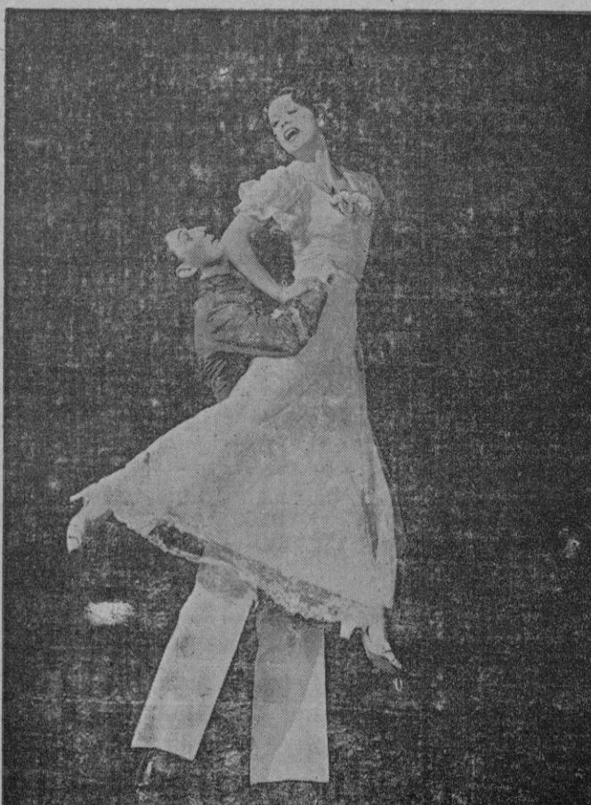
Una escena de ROSALIE que se estrenará el miércoles

Lewis Stone - Mickey Rooney - Cecilia Parker Justo y hábil, vence a sus enemigos con sus propias armas, impone la justicia con su inteligencia y restablece con sus enseñanzas la paz en su hogar.